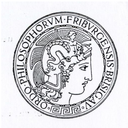
Siegel der Philosophischen und der Philologischen Fakultät

Seit 1490 ist ein Siegel der Fakultät belegt, das den Heiligen Lukas zeigt. Die abgebildete Umzeichnung stützt sich auf eine Version aus dem Jahr 1524.