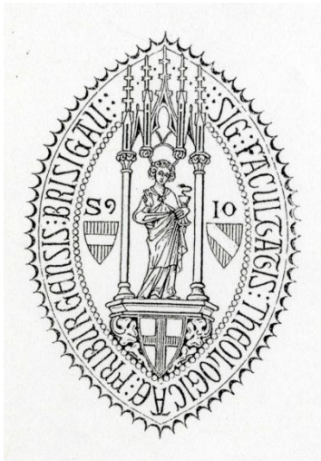
Siegel der Theologischen Fakultät

Ein Siegel der Theologischen Fakultät ist schon seit dem 15. Jahrhundert belegt und stellte in verschiedenen Versionen den heiligen Paulus dar. Das heute gebräuchliche Siegel aus dem Jahr 1910 stellt den Heiligen Johannes dar, der von Beginn an schon zweiter Patron der Fakultät war.