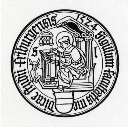
Siegel der Medizinischen Fakultät

Seit 1490 ist ein Siegel der Fakultät belegt, das den Heiligen Lukas zeigt. Die abgebildete Umzeichnung stützt sich auf eine Version aus dem Jahr 1524.