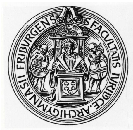
Siegel der Rechtswissenschaftlichen Fakultät

Ein Siegel der Theologischen Fakultät ist schon seit dem 15. Jahrhundert belegt und stellte in verschiedenen Versionen den heiligen Paulus dar. Das heute gebräuchliche Siegel aus dem Jahr 1910 stellt den Heiligen Johannes dar, der von Beginn an schon zweiter Patron der Fakultät war.